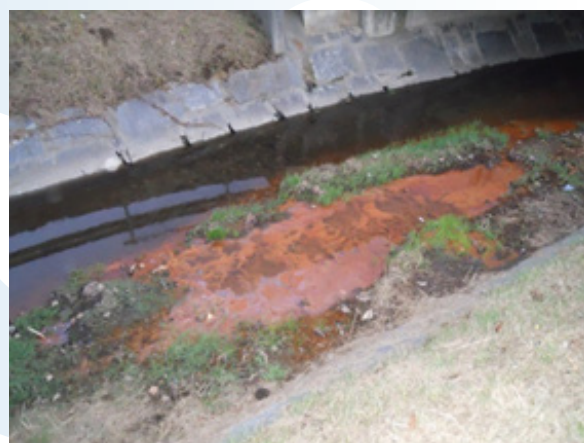
Fotografia 2: depositi di ossido di ferro e manganese con delle iridescenze a cristalli in superficie